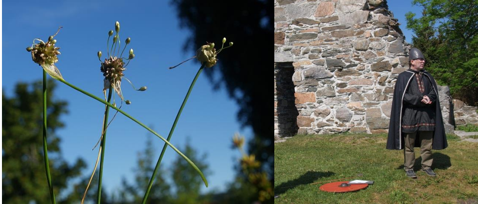
Figur 3 Allium oleraceum fra Tautra i forfatterens hage; dyrket av Vikingene i Trøndelag?