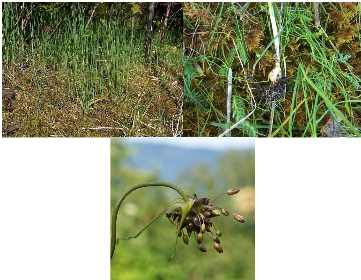
Figur 2 Vill-løk vokser i store mengder i en baserik strandskog like i nærheten av forfatterens hus i Malvik,ST.

En engelsk kollega av Dansken hadde avdekket en historie om en Engelsk misjonær biskop som hadde tatt med seg vill-løken når han bosatt seg i Borgarfjörður i minst 20 år på 1000-tallet! Løken hadde forvillet seg og klarte seg bra sannsynligvis fordi dette er et geotermisk område med tilhørende lokalt klima. Utrolig nok gikk historien på at vedkommende biskopen hadde faktisk tatt med seg løken fra Nidaros (Trondheim) og løkene hadde blitt hentet fra en øy utenfor byen! Det er to muligheter med historiske røtter: Munkholmen og Tautra! Kunne det være slik at navnet Geirlauk fra Tautra var faktisk svært gammelt og at det er en forbindelse med populasjonen på Island? Sirkelen kan kanskje avsluttes når det kan fortelles at i forkanten av seminaret i Danmark hadde undertegnede tatt kontakt med Reykjavik Botaniske Hagen med tanke på å bytte Allium frø. Det viste seg at de hadde materialet av Borgarfjörður-løken og februar 2009 kom løken tilbake til Trondheim nesten 1.000 år senere! Så, nå kan vi evt. sammenligne det islandske og norske materialet. Jeg har ikke klart å få et svar fra den engelsk-danske forskeren henvendelsene om dette og det viser seg at han var i Trondheim og besøkte Ringve og Munkholmen.... Historien også vitner om at vill-løk var faktisk verdsatt i Vikingetiden og dette også styrker teorien om at dette var et av artene som var dyrket i Vikingenes laukgarder.