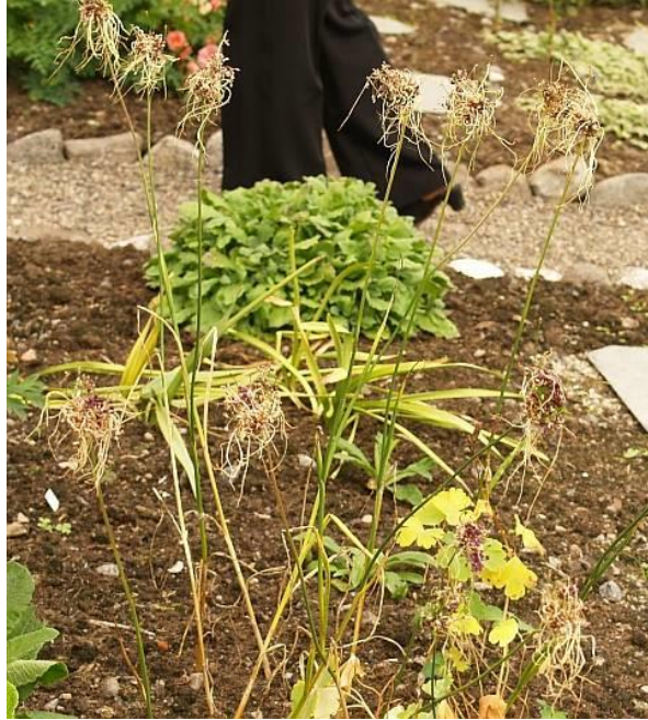
Figur 4 Allium vineale ? "Hair" i Rigmor Solberg's urtehage utenfor Sortland i Vesterålen.